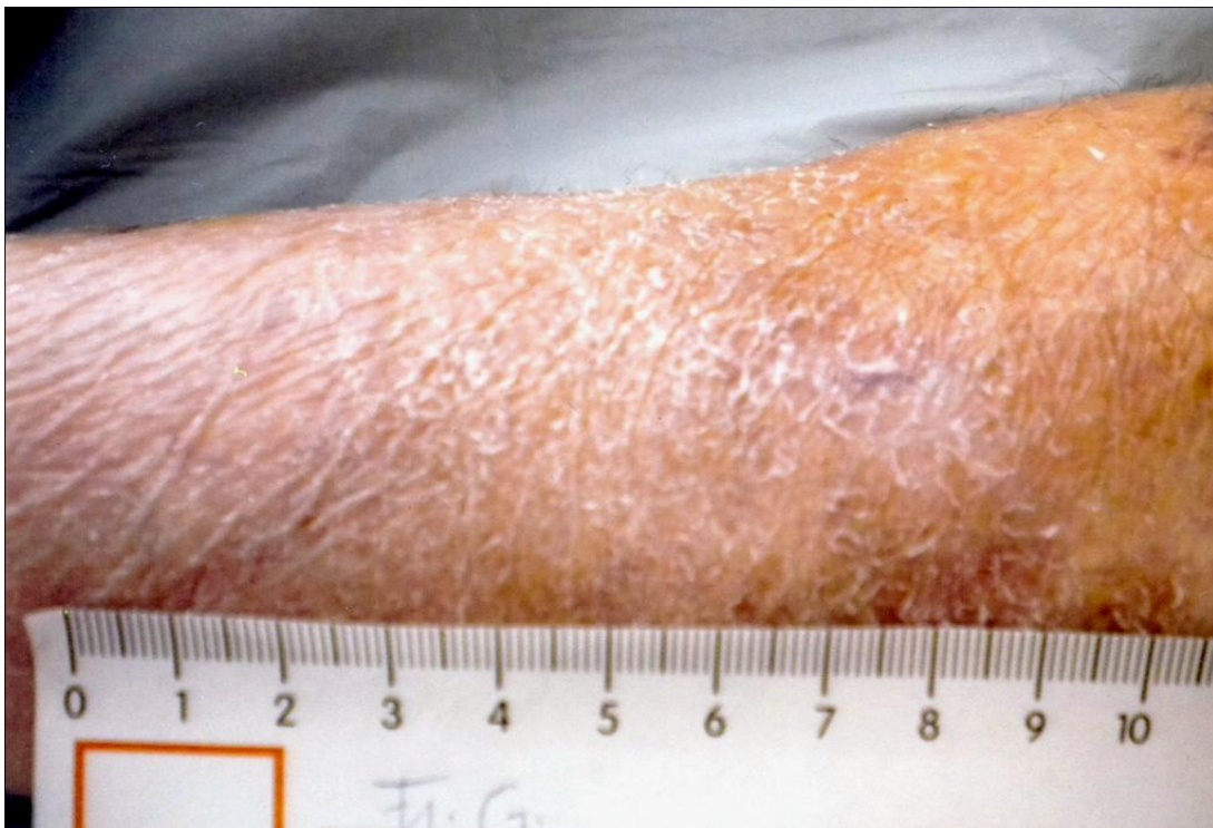
Abbildung 2: linker Unterschenkel, 30.05.2011

Die Patientin hat das Einmassieren und das Öl als sehr angenehm auf der Haut empfunden.