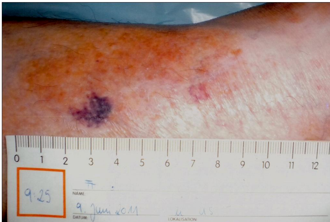
Abbildung 3: linker Unterschenkel, 09.06.2011

Nach 10 Tagen war das Hautbild deutlich glatter und die Schuppen sind fast gänzlich verschwunden. Zum Abschluss haben wir ein Foto am 9. Juni 2011 gemacht.