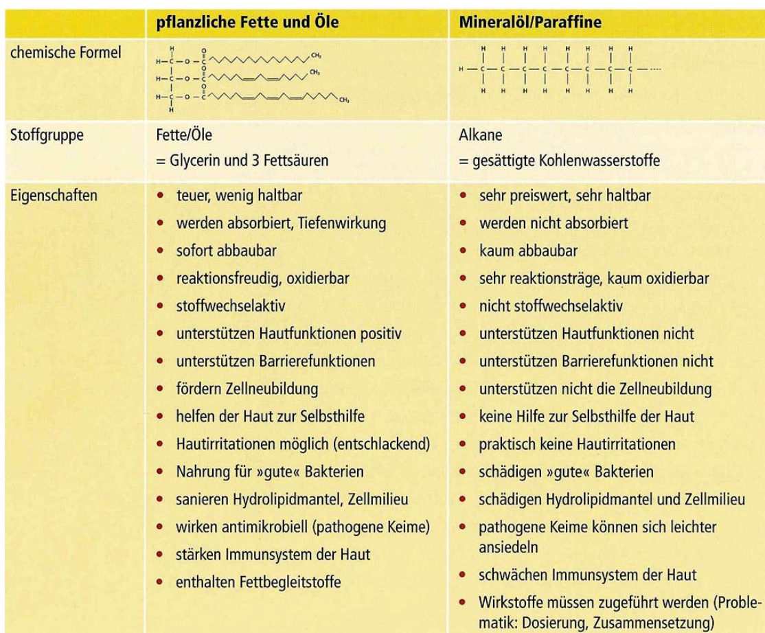
Tabelle: Pflanzliche Fette und Öle gegen Mineralöl und Paraffine

Den Unterschied sieht man sofort, wenn man einen Blick auf die chemischen Strukturen wirft. Denn Mineralöle und Paraffine wie Vaseline sind, chemisch gesehen, keine echten Fette. Sie sind kaum abbaubar und können viele biologische Systeme stören. vgl. Ruth von Braunschweig (2010)